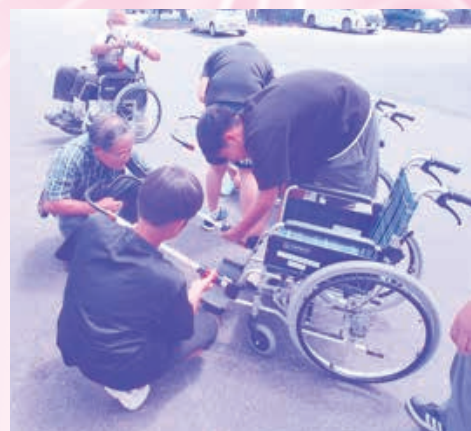
ボランティア体験講座の様子

会員の皆様からの会費を財源に、ボランティア・市民活動センターの運営や地区社協活動の支援など住民参加による福祉活動を推進し、みんなで支えあうまちづくりを目指しています。