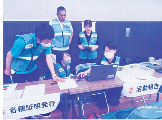
災害ボランティアセンター運営訓練の様子